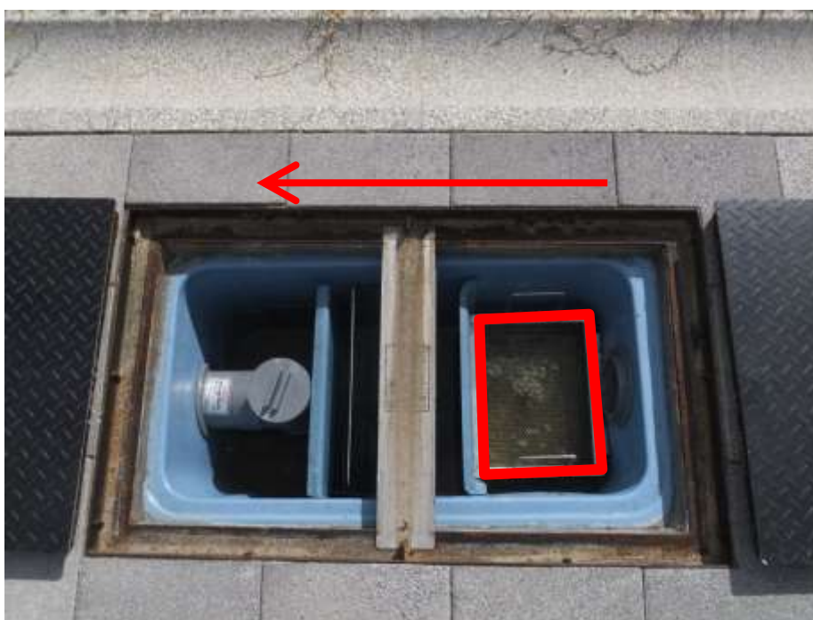
鉄蓋を開けた状態

※矢印方向が汚水の流れる方向になります。汚水を流す場合は、 写真赤枠 にあるバスケットにゆっくりと流してください。 使用後は、必ずゴミを取ってきれいに洗浄してください。