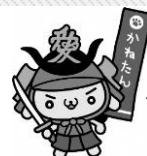
直江兼続 マスコットキャラクター 「かねたん」

米沢市 政策企画課 企画調整担当 電話: 0238-22-5111(内線2702)/ FAX: 0238-22-0498 E-mail: kikaku-t@city.yonezawa.yamagata.jp