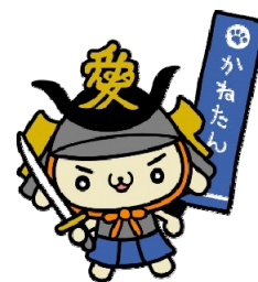
直江兼続マスコットキャラクター 「かねたん」

E-mail: seisaku-ka@city.yonezawa.yamagata.jp