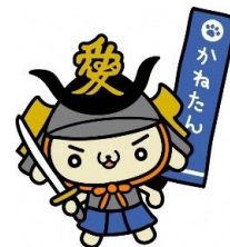
直江兼続マスコットキャラクター 「かねたん」

E-mail: kikaku-t@city.yonezawa.yamagata.jp