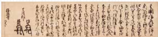
【富山県指定文化財「勝興寺文書」】 (元亀3年・1572)10月1日 勝興寺宛武田信玄・勝頼連署状 (勝興寺・高岡市) 後期