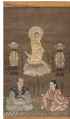
長尾政景夫妻像 (常慶院・米沢市) 前期