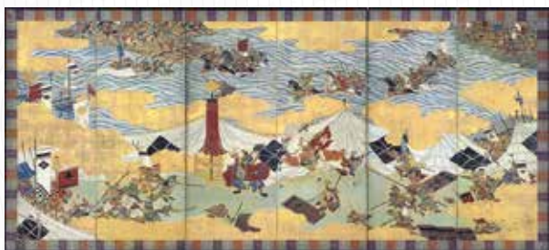
川中島合戦図屏風(長野県立歴史館・千曲市) 前期