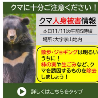
市民への注意喚起(市公式LINE)