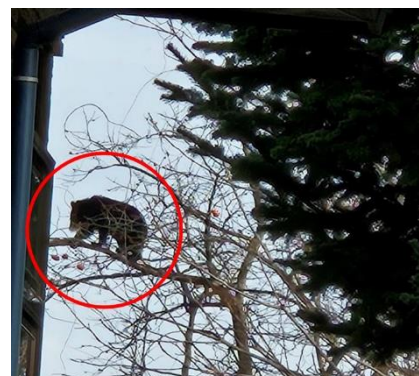
住宅地の木に登るクマ