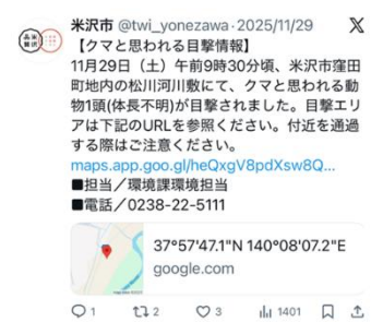
クマ目撃情報の発信(X)