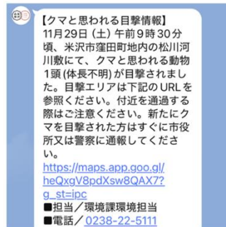
クマ目撃情報の発信(市公式LINE)