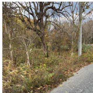
ヤブの刈払い、雑木林の伐採