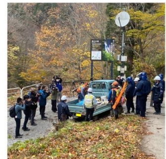
緊急銃猟の体制整備