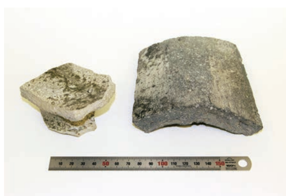
▲威徳寺北遺跡出土須恵器高坏（左）、瓦（右）