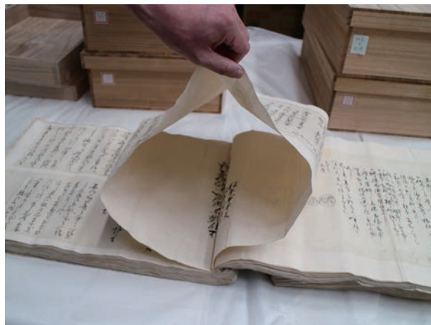
▲後世に貼り継がれた文書