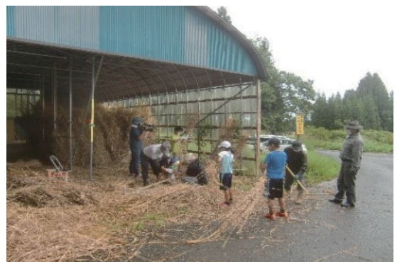
▲差し茅の材料づくりワークショップの様子

差し茅と同時に開催したワークショップには、多くの親子連れが参加し、実際に文化財修理の様子に触れることで、文化財保護への関心や理解を深めてもらう機会となりました。