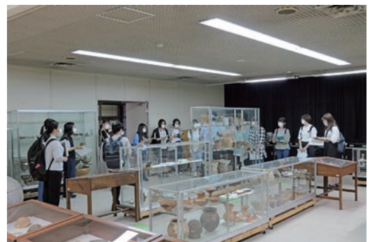
▲米沢女子短期大学の資料室見学風景