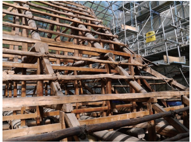
▲保存修理が進む普門院本堂

また、山形県ヘリテージ・マネージャー養成講習会の一環で建築士の方々が訪れるなど、歴史建造物保存修理の学習の場としても活用されています。