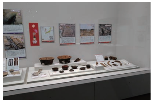
▲群馬県立歴史博物館での展示風景

埋蔵文化財資料室は地元の米沢女子短期大学の授業や、一般の方々の見学で利用していただきました。さらには、考古学等の専門家による調査・研究のため、戸塚山137号墳や花沢A遺跡等の資料調査に協力しています。