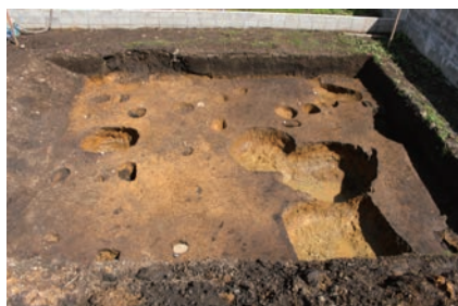
▲米沢城跡調査区全景（南から）

個人住宅建設に伴って緊急発掘調査を実施しました。本遺跡を含む大浦遺跡群は、これまでの調査で大規模な建物跡や柱列が確認されていますが、今回の調査でも、古代及び中世の掘立柱建物跡の一部が確認できました。遺物は、瓦質土器の小破片が数点出土したのみでした。