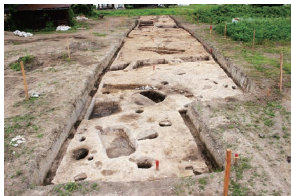
▲威徳寺北遺跡調査区完掘状況（南から）

埋蔵文化財に関する発掘届及び分布調査の依頼件数は、令和4年2月28日現在45件で、このうち、前述の威徳寺北遺跡を含め、5件で緊急発掘調査を実施しました。