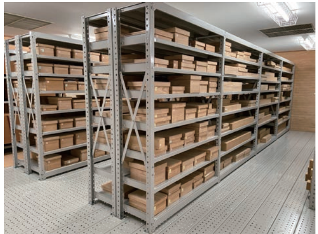
▲上杉文書収蔵状況