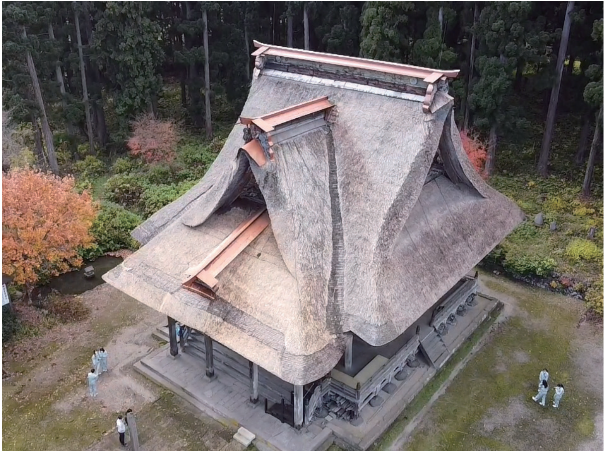
▲米沢工業高等学校生徒による県指定文化財笹野観音堂のドローン撮影風景

今年度、山形県立米沢工業高等学校建設環境類の御協力をいただき、授業の一環として指定等の文化財建造物や史跡のドローン撮影を4箇所を実施しました。普段は見るできないアングルからの画像や動画は、広報用としての活用だけではなく、地上からではわからない劣化やき損の早期発見にも繋がり、文化財の保存にも大いに役立ちます。また、ドローン操作の実習と共に、高校生が文化財を通して地元の歴史を学ぶ機会を提供できました。