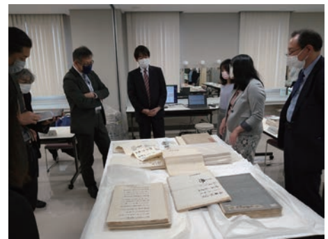
▲調査委員会の様子

米沢市と上杉博物館が事務局となり、文化庁・山形県・外部の専門家で構成される上杉文書調査委員会の指導を受け、福島大学・東北芸術工科大学・米沢女子短期大学とも連携して調査を進めています。