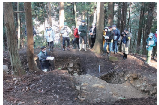
▲史跡館山城跡発掘調査現場見学会風景