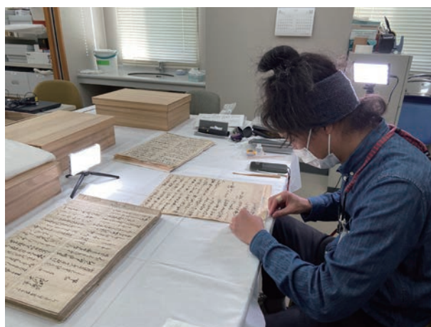
▲撮影が終わった史料の解体作業