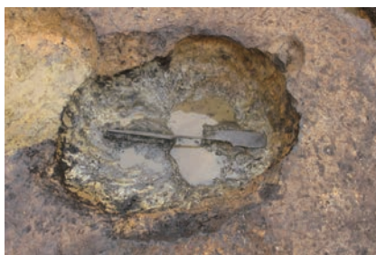
▲米沢城跡土坑遺物出土状況