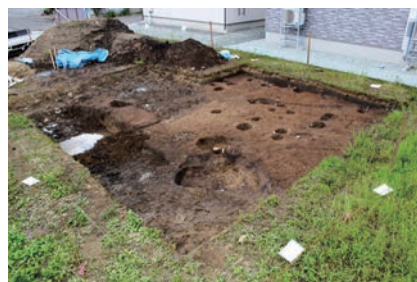
▲大浦C遺跡調査区全景（北から）