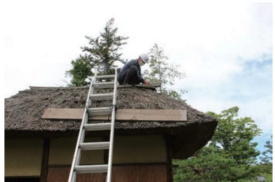
▲行屋小修理の様子

国有形民俗文化財の「行屋」は農村文化研究所に2棟、米沢市上杉博物館（置賜の庭）に1棟が所在しています。上杉博物館所在の1棟が風雨被害により屋根部の杉皮が欠落したため、市の直営により杉皮を補う修理を実施しました。茅葺の技能を有する会計年度任用職員による修理で文化財の保護を図りました。