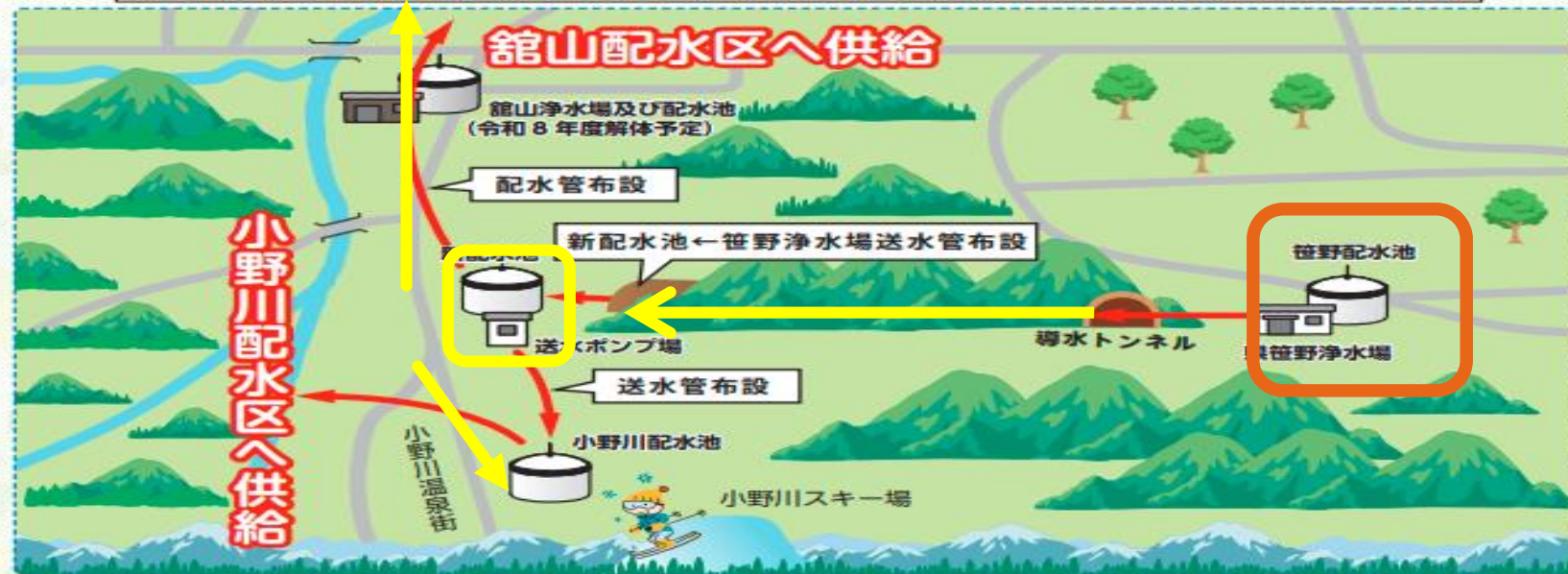
笹野浄水場の水道水を舘山配水区及び小野川配水区に供給するための工事のイメージ図

なお、現在、舘山浄水場の水道水を供給している地域は、舘山、矢来、広幡町、六郷町、窪田町の一部、成島町の一部、小野川町の一部、赤芝町、大字築沢の一部です。