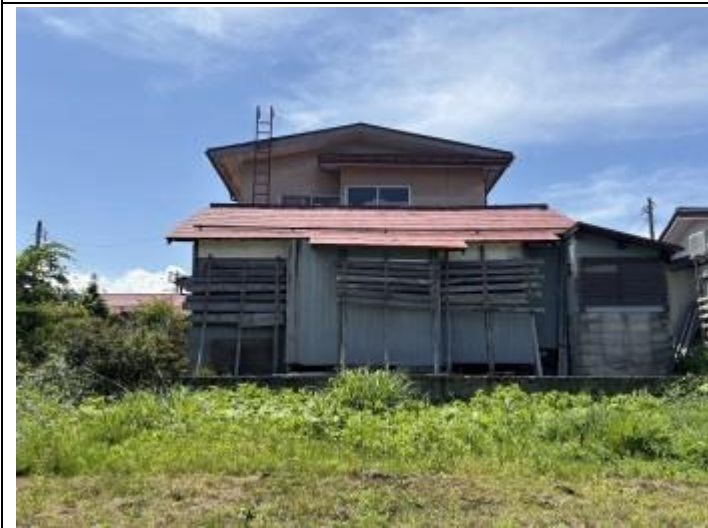
03 居宅 (南→北)