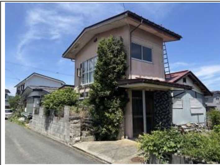
01 居宅 (南東→北西)