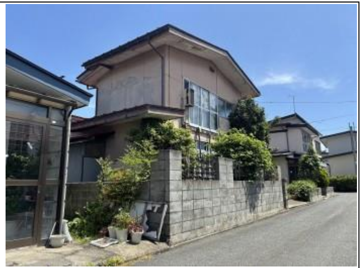
02 居宅 (南西→北東)