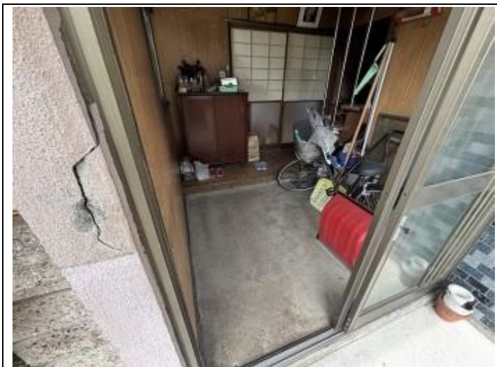
13 玄関 (外側から)