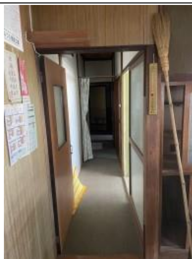
10 1F 廊下