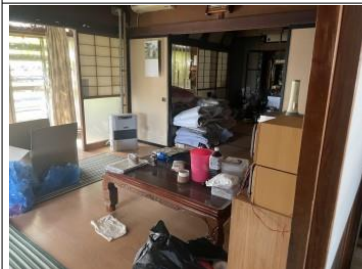
09 1F 茶の間