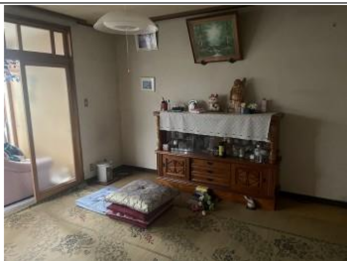
08 居室 1