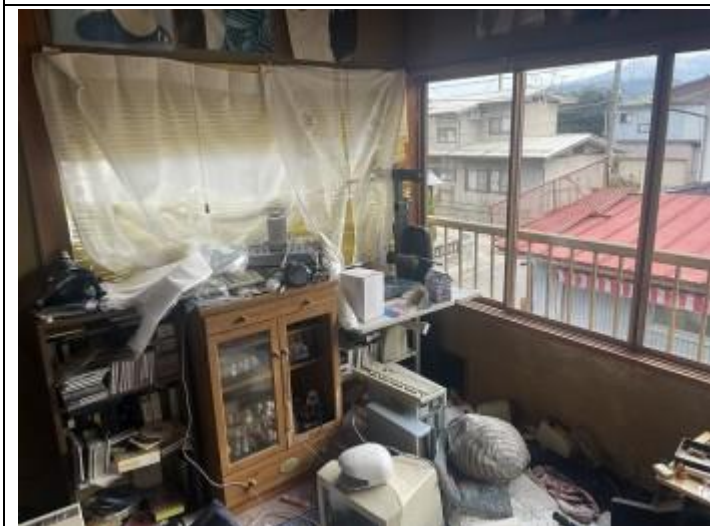
11 居室 4