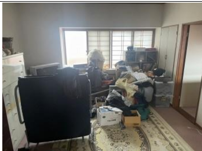
12 居室 5