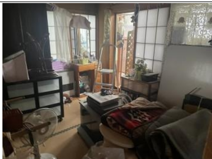
10 居室 3