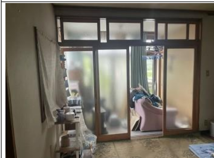
09 居室 2