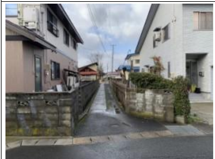
05 前面道路（二項道路）入口 （市道から）（東→西）