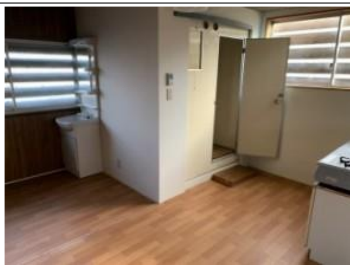
14 キッチン、風呂、洗面所