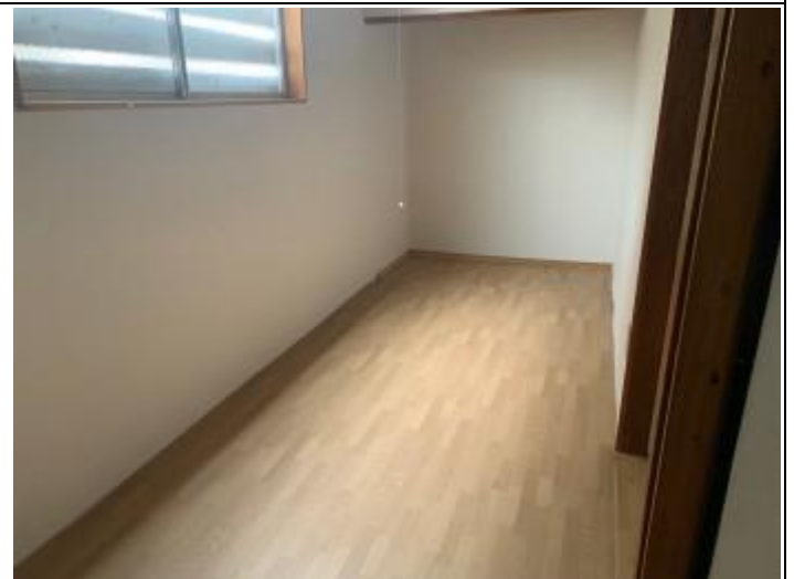
12 1階納戸 (洋室)