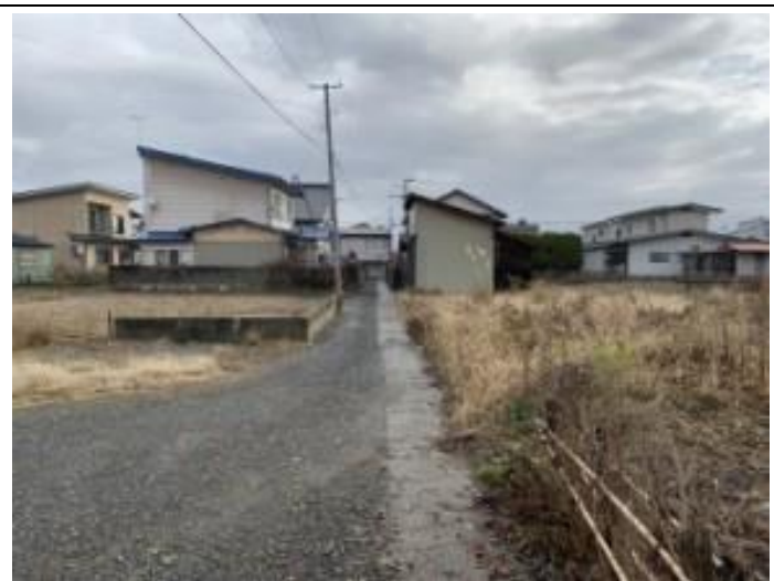
04 前面道路（二項道路）（西→東）