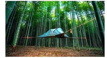
竹林の景観を活かした キャンプ事業の創出