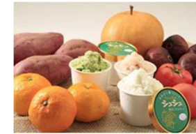
地域の農林水産物で 新商品を開発