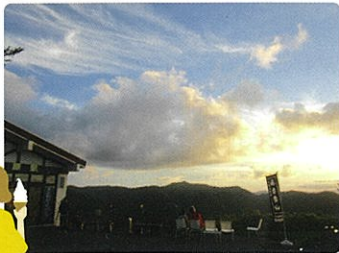
広がる雲海、自然が織りなす色鮮やかな夕日。

『東北のアルプス』飯豊連峰の山脈をはじめとする山形名山の眺望。 広がる雲海や色鮮やかな夕陽、という小さな奇跡の瞬間。 +5mの視点を味わう「雲上テラス」が、家族のドキドキとワクワクを高めてくれます。 雲の上の天元台高原で、家族の時間を楽しみませんか。