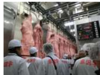
【米沢市食肉センター】