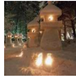
上杉雪灯籠まつり