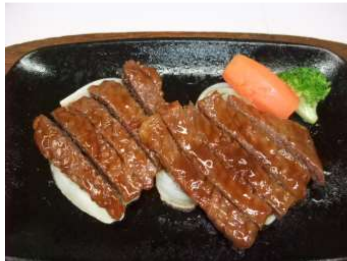
【米沢牛味噌粕漬物】

米沢牛の弁当 ：米沢牛にこだわった風味豊かでちょっと贅沢なお弁当。東日本でNO.1に選ばれた駅弁があるなど、デパートの催事、各種イベントなどでも大人気です。