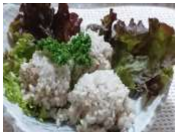
【米沢牛シュウマイ、米沢牛コロッケのイメージ】

また、飲食店でのメニューとして定番のステーキ・すき焼き・しゃぶしゃぶ以外にも、米沢牛そば、米沢牛シュウマイ、米沢牛コロッケなど、銘柄牛のブランド価値を活用した商品開発が進められています。