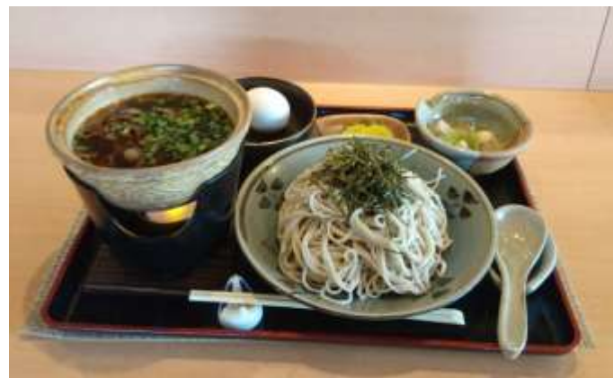
【米沢牛そばのイメージ】