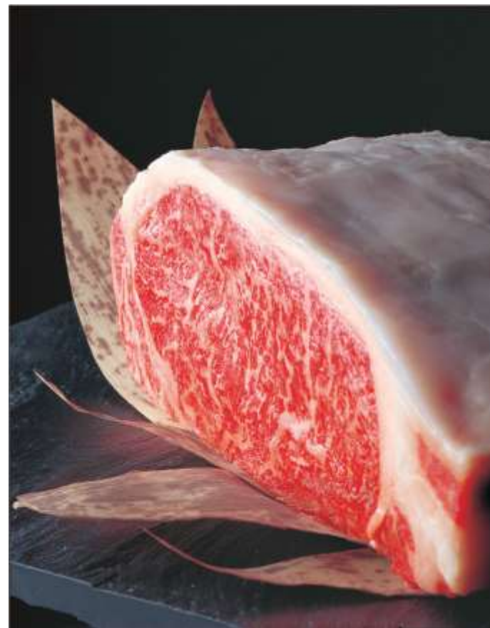
平成29年3月3日、農林水産省認定の地理的表示GI保護制度に登録。

米沢牛の定義には、「32カ月の長期飼育」が盛り込まれています。これにより、旨味成分のオレイン酸が増加し、おいしい牛肉になります。また、稲作との複合経営を行っている農家が多く、自分の目の届く範囲の頭数を飼育し、自分の田でとれた良質の稲わらを与えるなど、一頭一頭を丁寧に育てています。