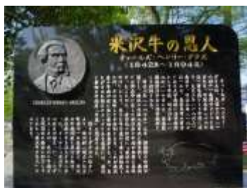
【チャールズ・ヘンリー・ダラス氏の顕彰碑】

さらに、米沢市松が岬第2公園内に建立された チャールズ・ヘンリー・ダラス氏の顕彰碑 により、明治初期に始まる米沢牛の歴史を伝えています。