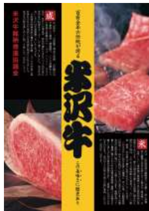
【米沢牛銘柄推進協議会ポスター】

米沢牛の繁殖に寄与する 吾妻山ろく放牧場 や、米沢牛のと畜と枝肉せり市場を有する 米沢市食肉センター の設置、管理運営により米沢牛の生産と食肉の円滑な流通を支援しています。