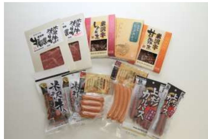
【米沢牛関連の加工食品群】