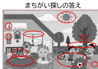
まちがい探 たん しの答 こた え

日 ひ かげや涼 すず しい場 ばしょ 所にすぐ いどう に移動 たすけ して、おとなに助 たすけ けをもとめましよう。ゆっく ゆっく りと冷 つめ たい水 みず かお茶 ちや を飲 の み、首 くび やわき わき の下 した を冷 ひ やします。いのち いのち に危 きけん 険 けん がある症 しやうじょう 状 じょう があれば、すぐ ばん 119番 ばん 通 つう 報 ほう (救 きゅう 急 きゅう 車 しや )をしまし しやう よう。