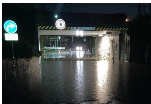
【No. 3 市道花沢バイパス松川橋線（花沢ガード）】