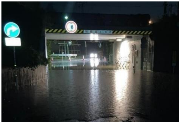
【No. 3 市道花沢バイパス松川橋線（花沢ガード）】