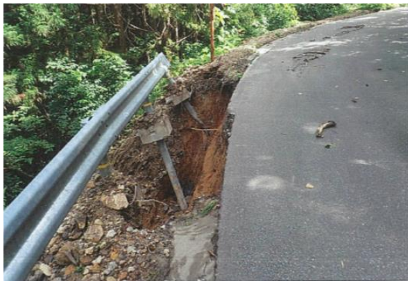
【No. 11 天狗沢線】