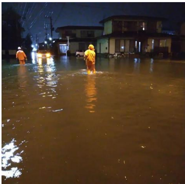
【No. 2 県道米沢高島線】