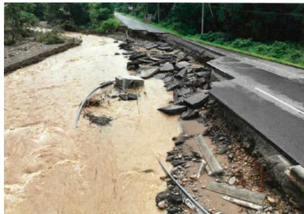
④国管理国道、高速道路