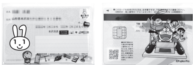
▲(ドラえもんグッズの例) マイナンバーカードケース マイナンバーカードに記載している個人番号などの情報を目隠しできるカードケースです。

12月20日(月)からグッズと引換えをします。整理券をご持参のうえ、市役所マイナンバー臨時窓口にお越しください。