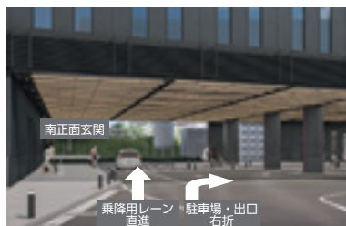
※南正面玄関前ロータリー内