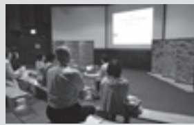
ナイトツアーの様子