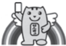
明るい選挙キャラクター「選挙のめいすいくん」