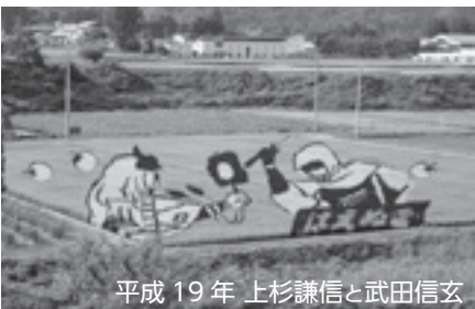
平成19年 上杉謙信と武田信玄