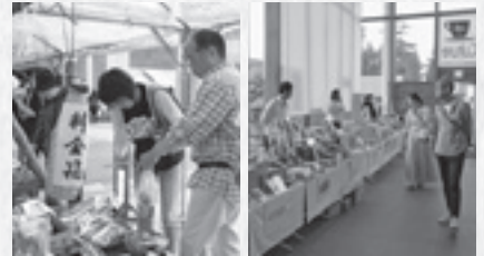
無人市である「棒杭市」 横浜のブランドが並ぶ

秋まつりは今年も伝国の杜周辺で行われました。市内の大学生が運営した「棒杭市」のほか、今年は「横浜秋の物産展」も開催。本場の味と品が並びました。