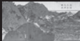
五雲亭貞秀「奥羽三景之内米沢」