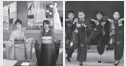
未来せんいアワード 市民ミュージカル「Faith」

伝国の杜では、新製品などのコンテスト「未来せんいアワード」や「Faith」の上演、ワークショップなどを開催。愛宕山山頂での碑前祭も行われました。