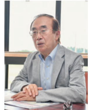
市立病院 病院事業管理者

新しい市立病院と三友堂病院は、医療の機能分化および医療連携の充実をコンセプトにして、患者さんに対する医療の提供を行います。市立病院・三友堂病院それぞれの役割や今後の地域医療などについて、両病院の代表者にお話を伺いました。