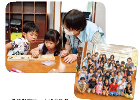
▲学童保育所への訪問活動 児童が放課後に安心して過ごせるよう、学童を訪問しています。学校や学童との連携はとても大切です。