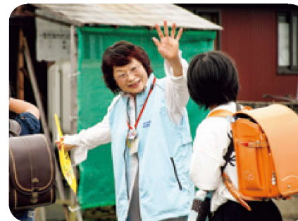
▲朝の立哨活動 地区の児童・生徒が安全に通学できるよう、車通りの多い横断歩道で様子を見守っています。