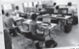
プログラミング体験会を開催