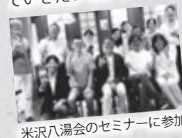
米沢八湯会のセミナーに参加