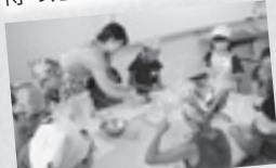
甘酒を使ったお菓子作り体験