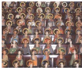
とうげんじ ごひやくらかんぞう 東源寺の五百羅漢像