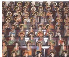
东源寺的五百罗汉像

东源寺境内的罗汉堂里陈列有五百罗汉像。所谓罗汉，在佛教中是指净悟佛道，修行达到最高境界的圣人。该寺27世的宗岳和尚，眼看当时人们生活受农作物欠收之苦，为了拯救人们的心灵，祈求农作物的丰收，因此他下决心定制罗汉像。北寺町的佛师为此花费了20余年的时间，终于在1863年时大功告成。五百罗汉表情各异，据说您必定可以在其中找到一二貌似您身边人的面相。各罗汉广开领悟之道，手持结下不解之缘的笔和经文等，头部后方还冠有金色法轮。