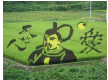
(去年的水田艺术画)

我们将筹办插秧体验活动，稻田选在在小野川温泉附近。用大地作画布，插上颜色各异的秧苗，表现今年的大型历史题材电视连续剧「天地人」的主人公「直江兼续」和其妻子「阿船」。请一起来参加稻田种画活动吧。