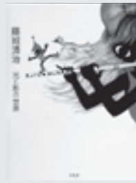
藤城清治 光と影の世界 作：藤城清治 出版：平凡社

幻想的影絵の第一人者・藤城清治の作品集です。初期のモノクロ作品から、最近のカラー作品まで収録されています。作品は美しく幻想的で見れば見るほど引き込まれていきます。実物を見るのが一番いいですけど、この作品集を見て光と影の世界を感じていただけたらと思います。