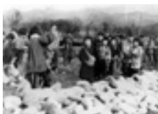
小学生も勤労奉仕（昭和18年）「米沢百年」より

報道写真にみる戦中戦後の日本と人々の暮らし／地上戦の記憶－沖繩戦とひめゆり学徒－／写真にみる米沢の戦中戦後、そして復興と成長の時代へ／ペーパークラフト作家中村隆行作品15点