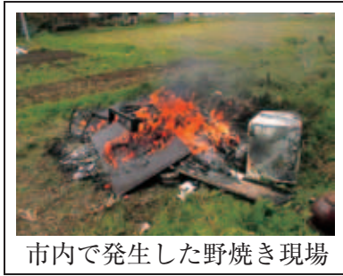
市内で発生した野焼き現場

ごみの野焼きは、一部の例外を除いて法律で禁止されています。違反した場合は、懲役・罰金の対象となります。ドラム缶などを使用した野焼きの苦情が跡を絶たず、タイヤや冷蔵庫、廃プラスチックなどを燃やす悪質な事例(左の写真)も発生しています。