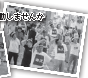
今年7月に行われた老人体育レクリエーション大会の様子